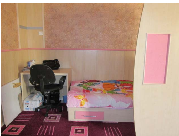
Sovekrok i sovesalen på jenteavdelingen (Dohuk). Hver inndeling har skrivepult.