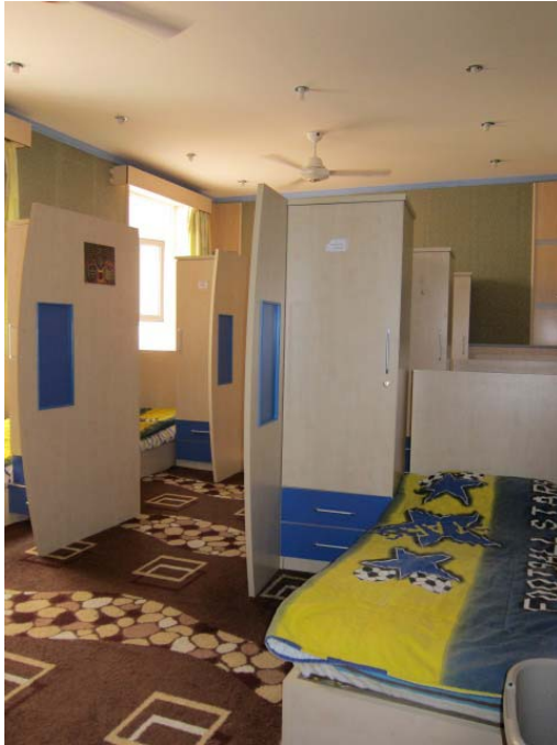
Fra en av sovesalene på gutteavdelingen (Dohuk). To rader med senger, som hos jentene.