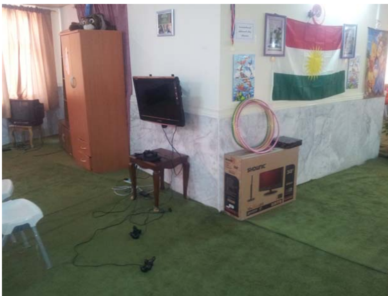
Fra oppholdsrommene (Sulaymaniya).