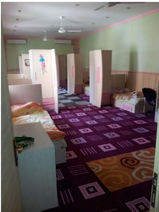
Sovesalen på jenteavdelingen (Dohuk).