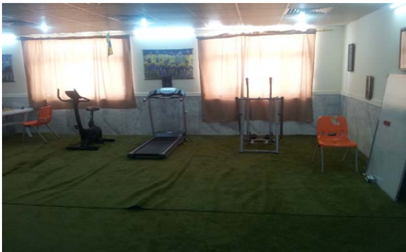
Treningsapparater som barna kan bruke (Sulaymaniya).

En av de ansatte fortalte at han i en lengre periode hadde jobbet på barnehjem i Sverige, og hadde på den bakgrunn gjort seg noen tanker om forskjeller mellom forholdene i Sverige og KRI. Han bemerket at mens barnehjemmene i Sverige hadde bedre materiell standard, og de ansatte bedre formelle kvalifikasjoner, hadde man bedre tid til barna på de kurdiske barnehjemmene: ”I Sverige var vi så travle med å ha møter, skrive rapporter og referater at vi hadde fint liten tid til barna. Her kan vi derimot sette oss ned med dem, eller gå ut og leke når som helst”.