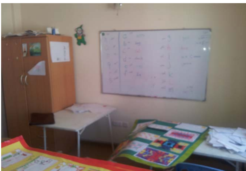
Undervisningsrommet der barna kan få leksehjelp (Sulaymaniya).

Skolegangen blir fulgt ved vanlig skole, og barna blir kjørt til og fra med egen transport. Barn som ikke består eksamen på skolen, blir sendt til privat ekstraundervisning.