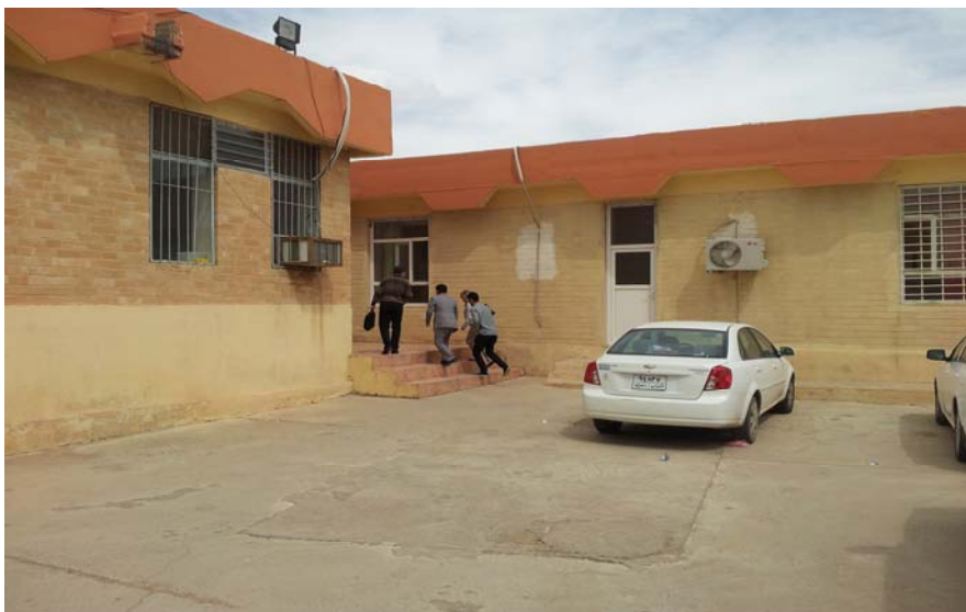
Inngangspartiet, gutteavdelingen (Dohuk)

de ansatte, mente organisasjonen. Harikar arbeider først og fremst med menneskerettsorienterte prosjekter, men har også i løpet av sitt virke siden 2004 hatt prosjekter rettet mot barn. Gjennom sitt lange samvirke med bl.a. myndighetene og ulike FN-organisasjoner fremstår organisasjonen som å ha et godt kjennskap til offentlig forvaltning på barnefeltet.