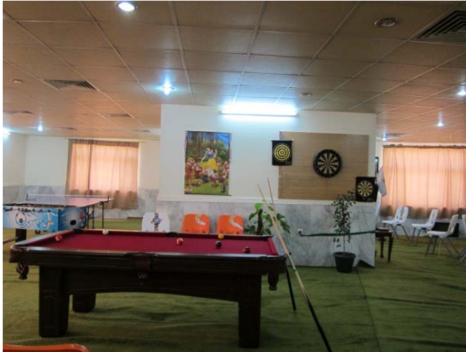
Fra oppholdsrommene (Sulaymaniya).

Bare unntaksvis blir barn boende over lengre perioder. Den som hadde bodd der lengst, var en gutt som kom som barn og ble boende til avlagt mastergrad i jus. Han arbeider nå som advokat. En jente hadde bodd der til hun var ferdig med farmasøytutdanningen sin.