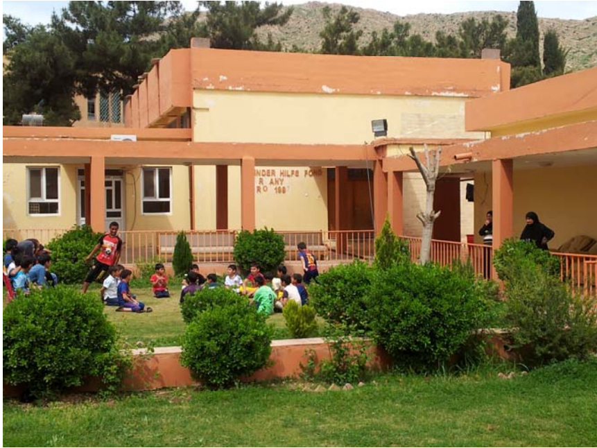
Utearealet på gutteavdelingen (Dohuk).