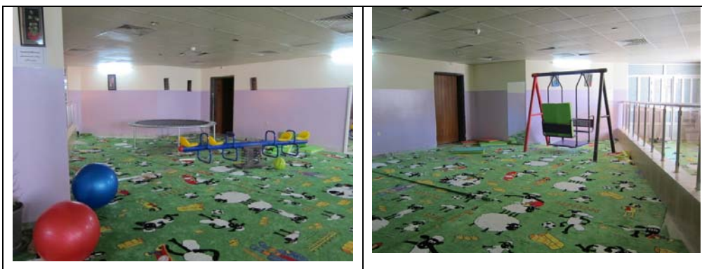
Lekerom for de minste barna (Sulaymaniya).

De separate jente- og gutteavdelingene er samlokalisert med et gamlehjem. Innen utløpet av første halvår 2013 er det meningen å åpne et akuttmottak for barn i krise i sammenheng med åpningen av et nødnummer for barn (116). På spørsmål om kapasitet svarte en av de ansatte at barnehjemmet har en viss overkapasitet, og nok plass til å ta imot alle som søker om plass der. De har aldri måttet avvise noen. I tillegg til sosialarbeidere har hver avdeling en lærer som tilbyr leksehjelp.