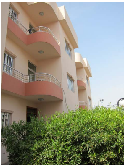
Barnehjemmet i Erbil.

arbeidet i Irak i flere år med beskyttelse av barn. I KRI samarbeider de med myndighetene bl.a. om å utvikle et fosterhjemssystem for foreldreløse barn.