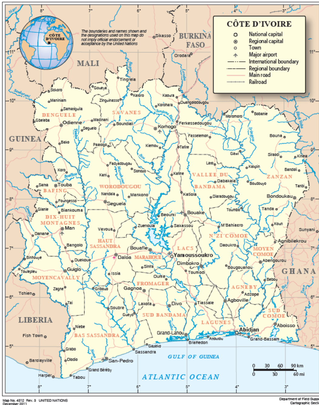
Kart over Elfenbenskysten (UN 2011).