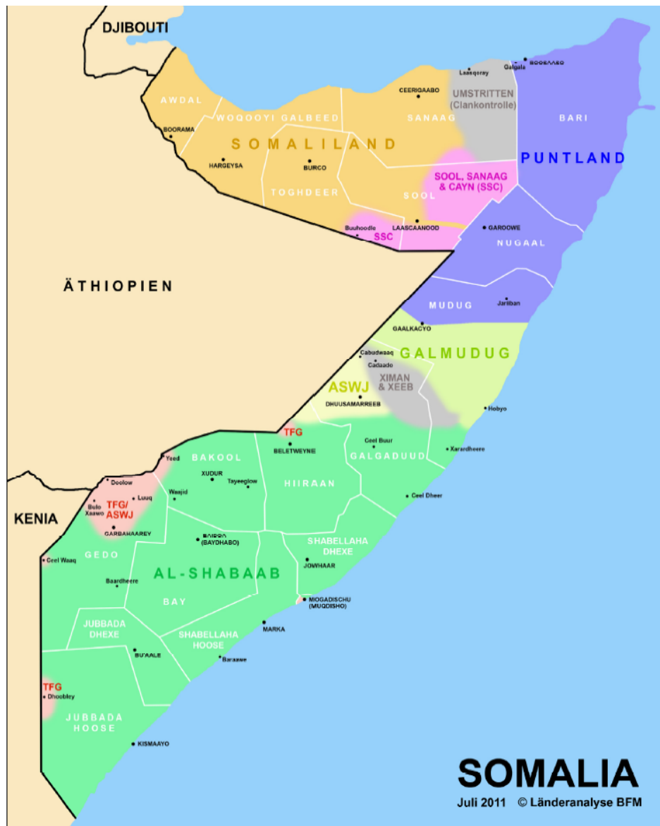
Controlezones in Somalië, juli 2011 (BFM 2011)