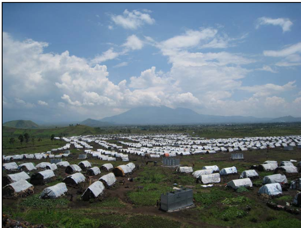
Leir for internt fordrevne utenfor Goma, oktober 2008.

Både FN og en rekke medier har rapportert om hevnaksjoner og angrep på sivile i FDLR-områdene etter tilbaketrekkingen. Anslagsvis 1,5 million mennesker er i dag internt fordrevne i Nord- og Sør-Kivu (OCHA 2009). Ca. 1 million av disse er i Nord-Kivu. 10