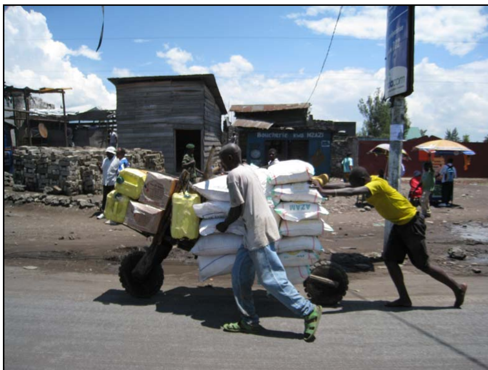
Varetransport i Goma.

På spørsmål om Goma er en etnisk delt by, forklarte en lokal kilde at enkelte deler av byen domineres av for eksempel nande og hunde. Men dette bosetningsmønsteret skyldes først og fremst at nykommere søker til områder hvor folk fra hjemstedet – og som regel fra ens egen etniske gruppe – har tilhold.